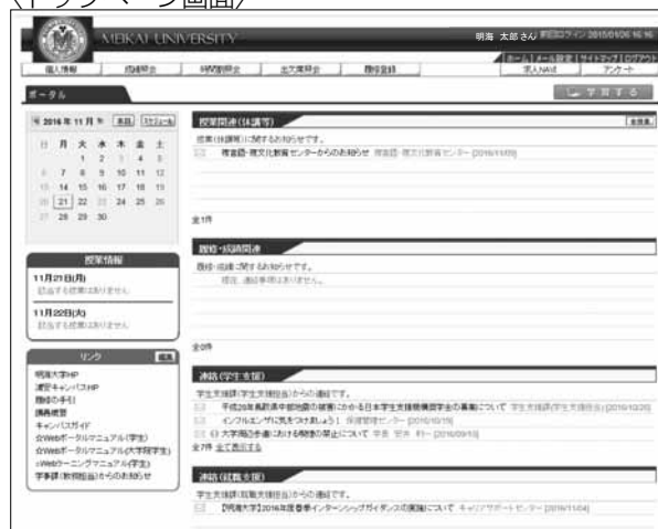
〈トップページ画面〉

また、パソコンや携帯電話等のメールアドレスを登録すると各種掲示情報がメール配信されますので、必ず登録してください。