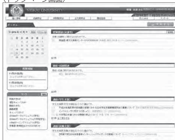
〈トップページ画面〉

また、パソコンや携帯電話等のメールアドレスを登録すると各種掲示情報がメール配信されますので、必ず登録してください。