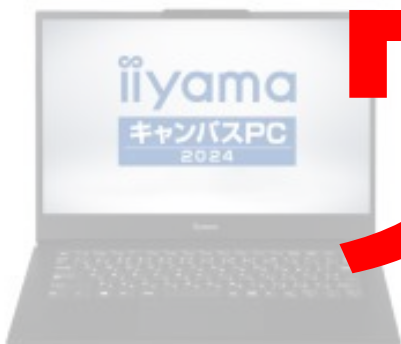
iiyama Campus PC