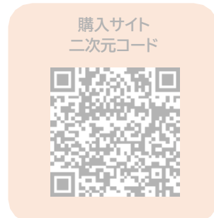
購入サイト 二次元コード

※保護者の方がご登録される場合も、 学生様のお名前 でご登録をお願いいたします。